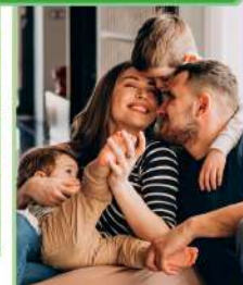
Преодоление трудной жизненной ситуации