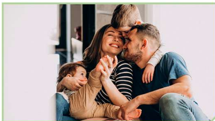
Преодоление трудной жизненной ситуации #СОЦРАЗВИТИЕ43