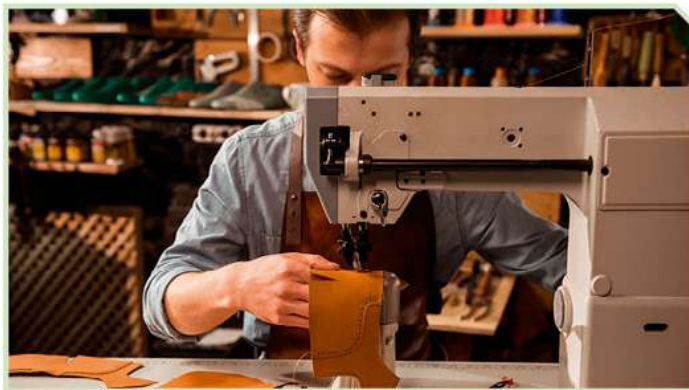
Осуществление индивидуальной предпринимательской деятельности