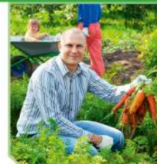
Ведение личного подсобного хозяйства