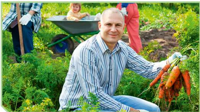
Ведение личного подсобного хозяйства